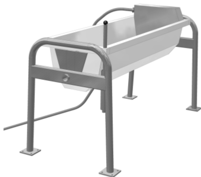
3. Poidło automatyczne obrotowe PAO-3