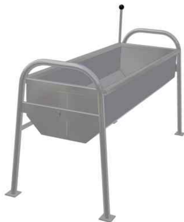
1. Poidło ł kowe obrotowe PŁO-1