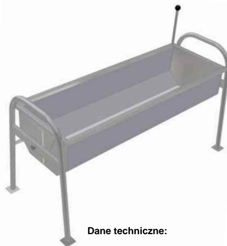
2. Poidło ł kowe obrotowe PŁO-2