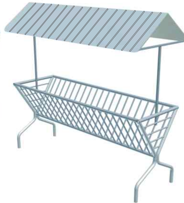
3. Paśnik łąkowy wolnostojący PŁW-2D 4. Paśnik łąkowy wolnostojący PŁW-2PD