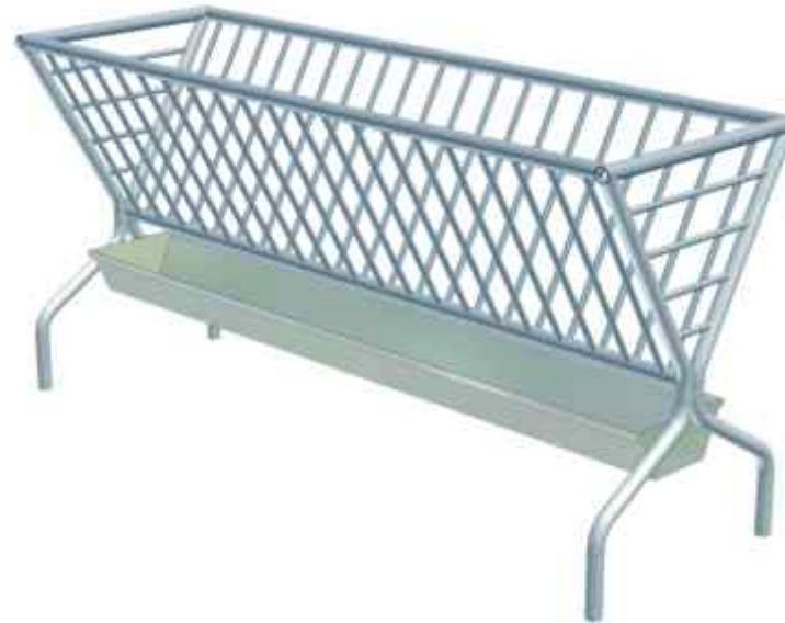
2. Paśnik łąkowy wolnostojący PŁW-2P