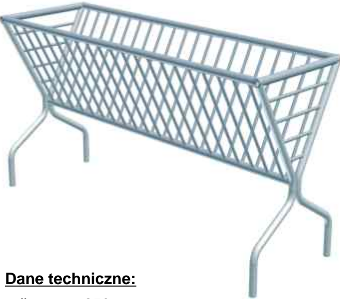
1. Paśnik łąkowy wolnostojący PŁW-2