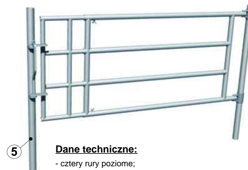
3. Furtka padokowa teleskopowa FPT-3