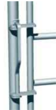
4. Zamek furtki padokowej ZFP